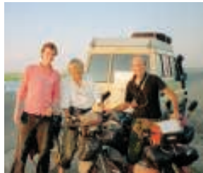
Begegnungen: Französische Radfahrer auf der Seidenstraße

bis zu 7.500 Meter hoch in den unvergleichlich klaren Himmel, mit Sternen zum Greifen nah. Die Wüste scheint auch nach stundenlanger Autofahrt immer noch unendlich. Die beiden