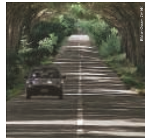
Beim Überholen oder Abbiegen wird der „unsichtbare“ Wagen zur tödlichen Falle.

Die Ebeling-Flotte bringt bereits jetzt Licht ins Dunkel, damit Fahrer und Transportgut ihr Ziel sicher erreichen.