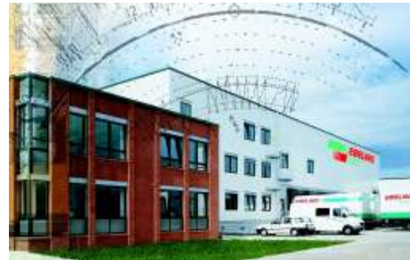
Der Verwaltungsbau wird um eine Etage aufgestockt.

Weitere vier neue Arbeitsplätze werden ab Herbst in der Verwaltung geschaffen, wenn das