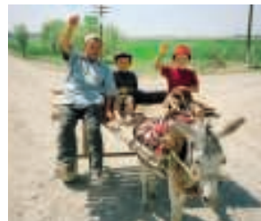
Stets gastfreundlich - die einheimische Bevölkerung

Die schneebedeckten Bergketten des Pamirgebirges, auch „Dach der Welt“ genannt, ragen