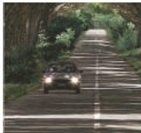
Rechtzeitig andere erkennen bzw. selbst erkannt werden hilft, heikle Situationen zu vermeiden.

Seit 1972 ist es in Finnland Gesetz: Das Fahren mit Licht am Tage. Auch in Schweden, Tschechien und Österreich und vielen anderen