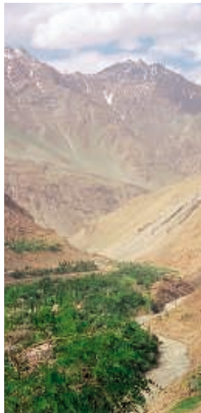
Fruchtbare Täler, die Lebensadern des Pamirgebirges

„Ach, es war so unbeschreiblich schön, dass man den Rest des Lebens davon zehren kann“, schwärmen die Globetrotter.